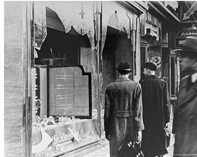
یک مغازه متعلق به یهودیان