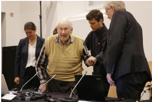
اسکار گرونینگ در دادگاه

انکار در زمانی صورت می‌گیرد که هنوز شهادت درباره فاجعه ادامه دارد. آخرین نمونه در سال ۲۰۱۵ اسکار گرونینگ (Oskar Gröning) ، متولد ۱۹۲۱، گروهبان اس اس در آشویتس، شروع محاکمه در آوریل ۲۰۱۵ در لونبورگ (شمال آلمان)، اتهام: مشارکت در قتل ۳۰۰ هزار نفر.