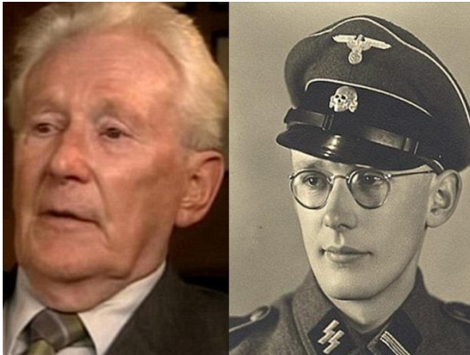
اسکار گرونینگ، جوان - پیر

انکار در زمانی صورت می‌گیرد که هنوز شهادت درباره فاجعه ادامه دارد. آخرین نمونه در سال ۲۰۱۵ اسکار گرونینگ (Oskar Gröning) ، متولد ۱۹۲۱، گروهبان اس اس در آشویتس، شروع محاکمه در آوریل ۲۰۱۵ در لونبورگ (شمال آلمان)، اتهام: مشارکت در قتل ۳۰۰ هزار نفر.