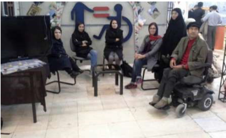
تصویر ۱۵: معلول و سالم برابرند

مفهوم عدالت اجتماعی: عدالت اجتماعی به این معناست که افراد برای کسب ثروت و فرصت و امکانات در برابری باشند. ۱ طبق نظریه جان راولز، فیلسوف آمریکایی قرن بیستم در حوزه اخلاق و سیاست، اصولی که برای دستیابی به عدالت در نظر می‌گیریم راه‌هایی برای تعیین معنای حقوق بشر در اختیار ما می‌گذارند و سازمان‌ها و نهادها بر اساس آنها تشکیل می‌شوند و بر اساس آنها راه درست توزیع مشارکت در معضلات اجتماعی صورت می‌گیرد (نک. مدخل John Rawls در دایره‌المعارف فلسفی دانشگاه استنفورد ذیل مفاهیم سیاسی عدالت ۲ ) ما عدالت را به این معنا به کار می‌بریم که هر کسی در جامعه به وظایفی که طبق حقوق بشر دارد (نه قوانین ایدئولوژیک یا مذهبی) عمل کند و از سویی در همه فرصت‌ها برای زندگی در کشورش با سایرین برابر باشد و این برابری شامل حذف هرگونه شاخص جسمیتی، جنسیتی، و نژادی و دینی و ملیتی و قومی و زبانی می‌شود. در ایران همواره صدای معلولان برخاسته و هرگز شنیده نشده است. به عنوان مثال به تصویر ۱۵ و متن خبر توجه کنید که در پشت سر افراد تصویری وجود دارد که از نابرابری گلایه کرده و خواستار برابری سالم و معلول است: (سالم=معلول). (برای توضیحات بیشتر به سایت خبرگزاری جمهوری اسلامی ایران در این لینک مراجعه کنید.)