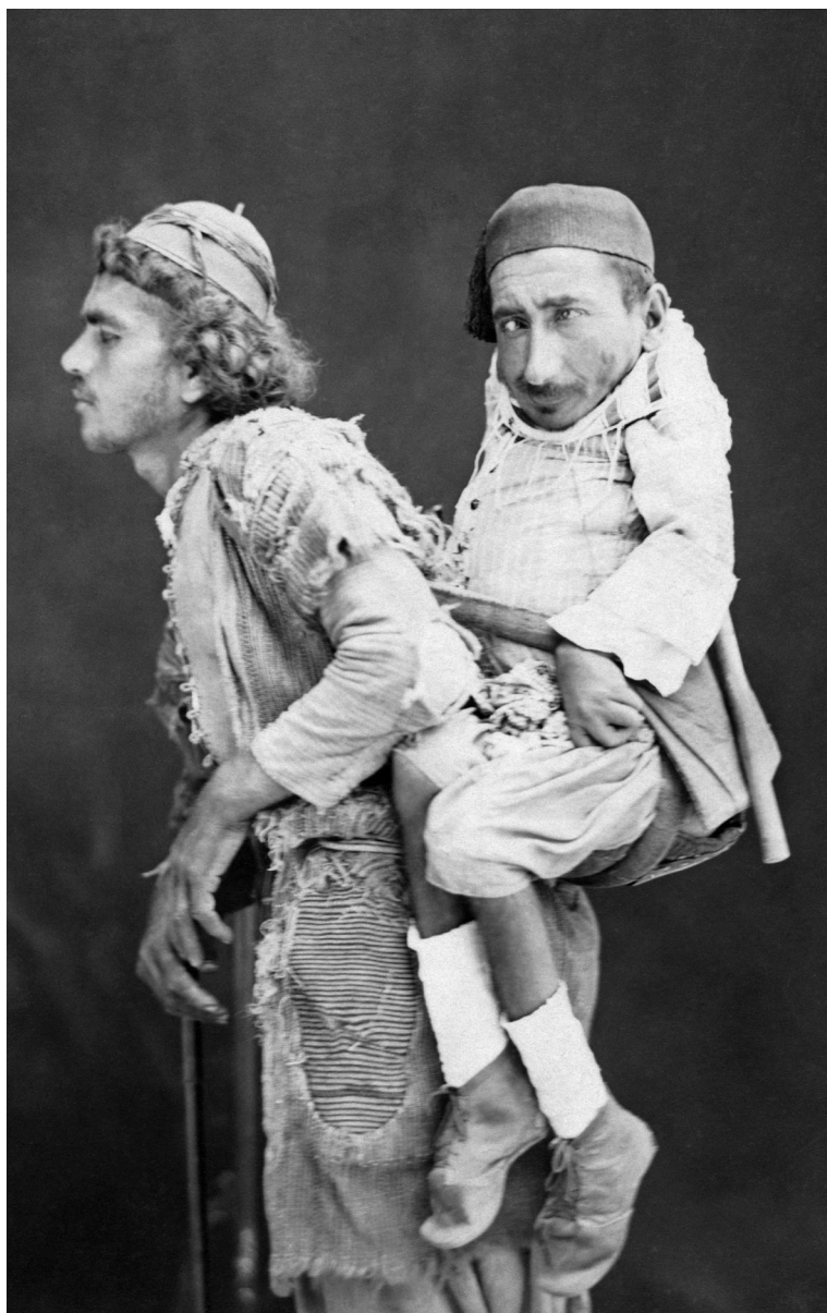
A blind man carrying a deformed man on his back in the Levant Tancrède Dumas, circa 1889.

تصویر ۲۱: فرد نابینایی فرد معلول دیگری را بر دوشش حمل می‌کند (مربوط به سال ۱۸۸۹).