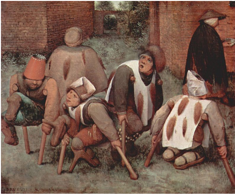
"Die Krüppel" (The Cripples) Oil on wood painting by Pieter Bruegel the Elder, 1568. تصویر ۸: نقاشی بالا اثر پیتر بروگل است (از سال ۱۵۶۸) که موضوع فقر معلولان را نشان می‌دهد.

چگونه می‌توانیم از مفهوم سیاست بدن برای تشریح این موضوع استفاده کنیم که چگونه معلولیت شکل گرفته است؟ چنان‌که تامس لمکی، استاد جامعه‌شناسی در دانشگاه گوته در فرانکفورت، شرح می‌دهد، منظور فوکو این است که سیاست بدن روشی در اعمال قدرت است و، به زعم لمکی، در سایه این سیاست، «پدیده‌هایی که منحصر به انسان - به منزله یک گونه - بوده در عرصه دانش و قدرت و در عرصه فناوری سیاسی وارد شده‌اند» (۵). منظور فوکو این است که سیاستی که بر پایه بدن شکل گرفته، نظامی را ایجاد کرده که فناوری را در خدمت سیاست آورده است و آن وجوه و شاخص‌هایی را که به زندگی و حیات فردی انسان و به تن او ربط داشته وارد سیاست کرده است. به عنوان مثال، چشم‌ها با تلفیقی از علم پزشکی و سیاست برنامه‌ریزی نیروی انسانی در نظامی تحلیلی قرار می‌گیرند که منافع و مصالح حکومت و اقتصاد سیاسی بر آورده شود و ارزش ذاتی و قائم به ذات انسان در این میان در پیوند با کلیت نظام و سایر انسان‌ها و ساختار فیزیکی کشور معنا دارد. اتفاقی که می‌افتد این است که در سایه نظام‌هایی که ارزش انسان را حیات او تعیین نمی‌کند، جسم مولد