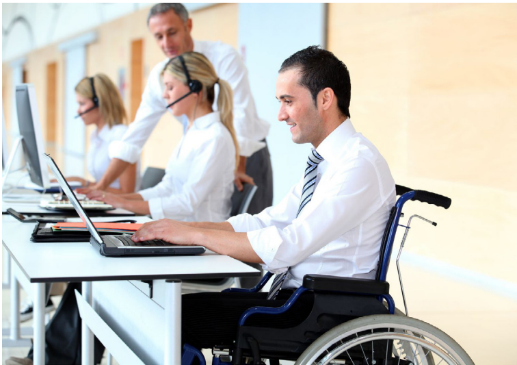
تصویر شماره ۱۷